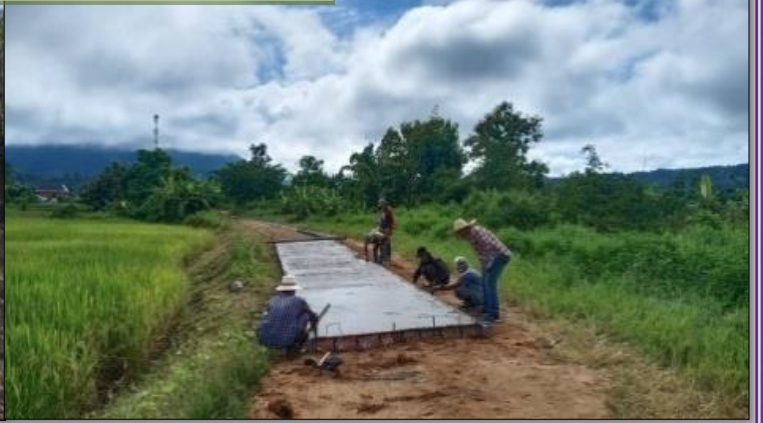
โครงการก่อสร้างถนนคอนกรีตเสริมเหล็ก หมู่ที่ 4 ตำบลเวียง